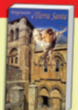
Libro-Guía de Tierra Santa