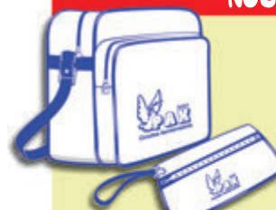
Bolsa y cartera documentación