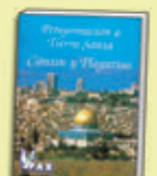
Libro de Cantos y Plegarias

Cada día se celebrará la Santa Misa en los lugares más significativos