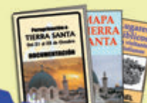
Información completa, etiquetas...